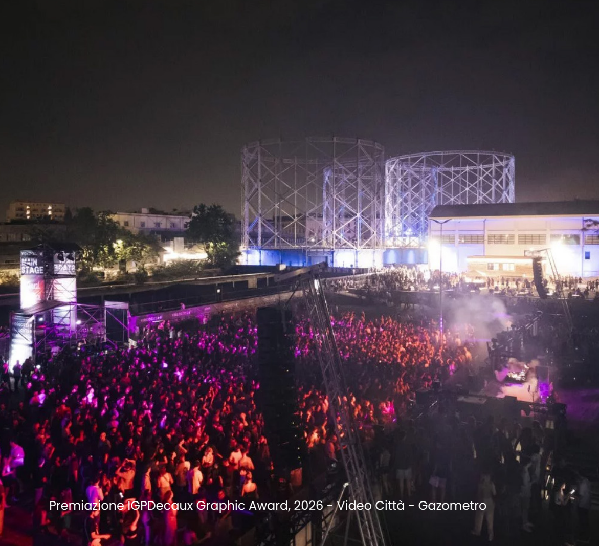
Premiazione IGPDecaux Graphic Award, 2026 - Video Città - Gazometro