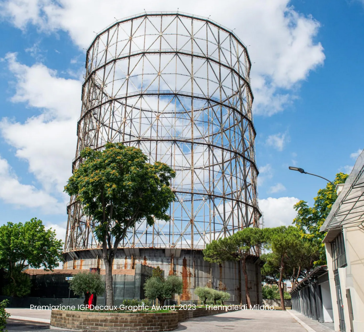
Premiazione IGPDecaux Graphic Award, 2023 - Triennale di Milano.