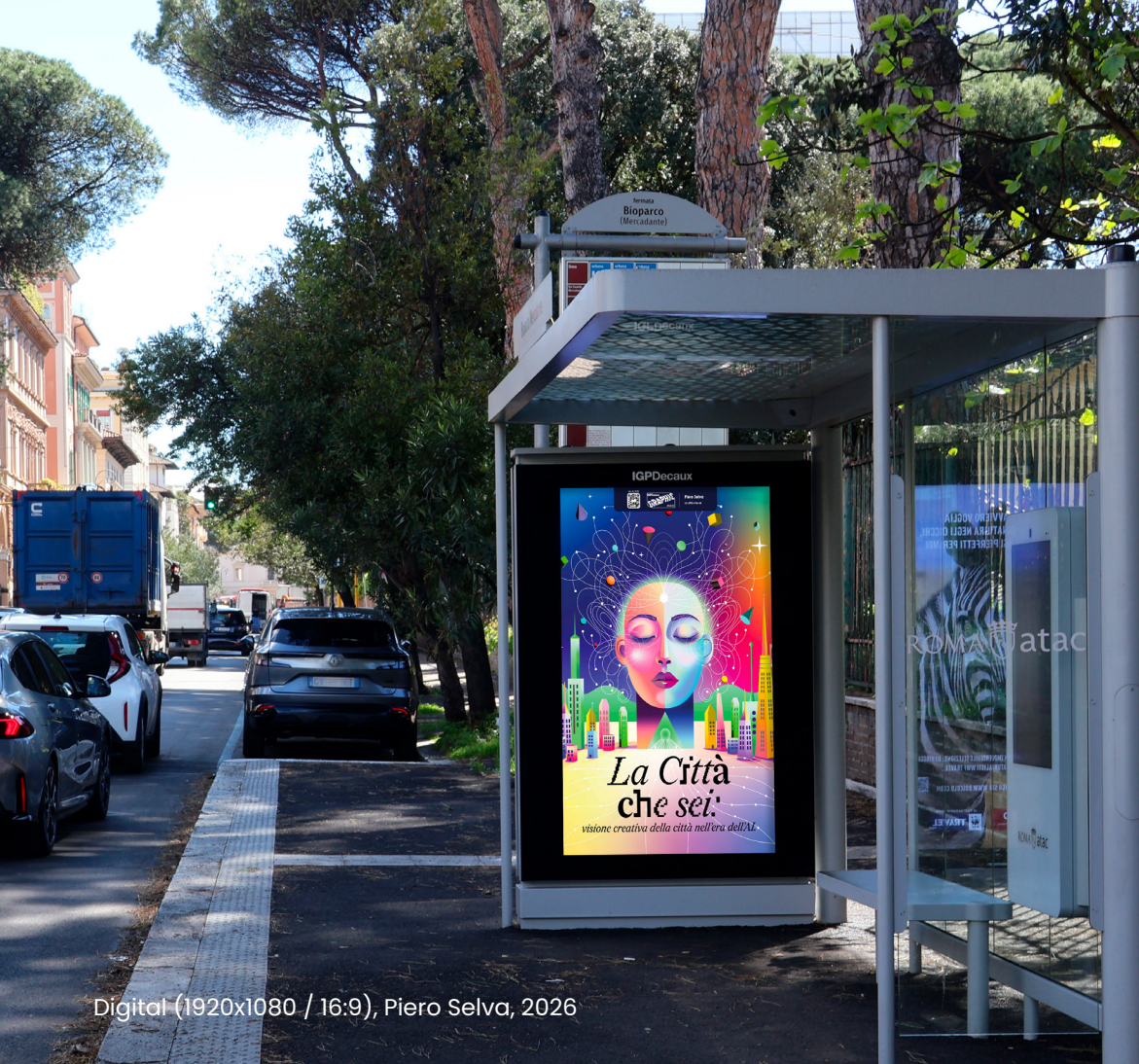
Digital (1920x1080 / 16:9), Piero Selva, 2026