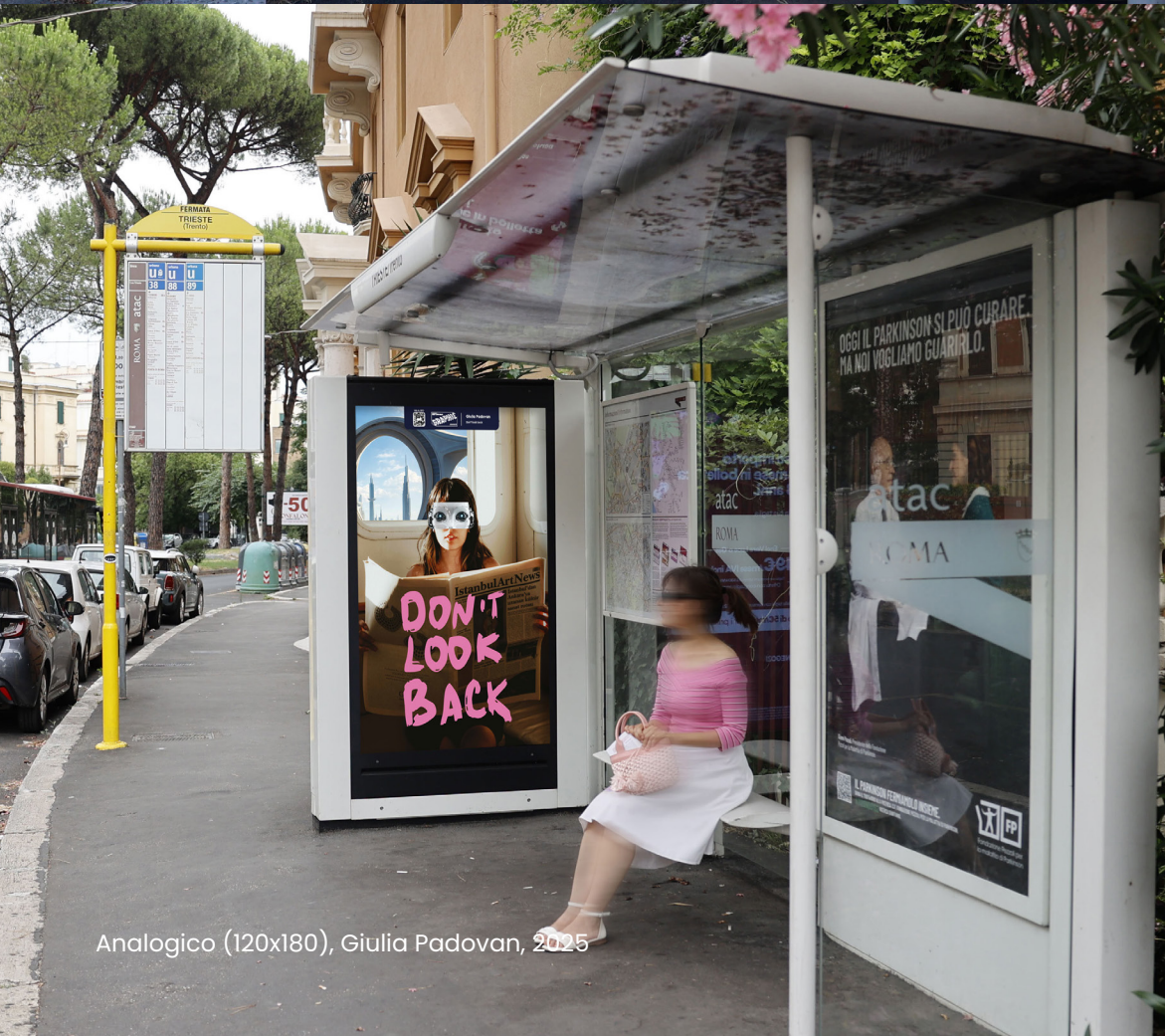
Analogico (120x180), Giulia Padovan, 2025